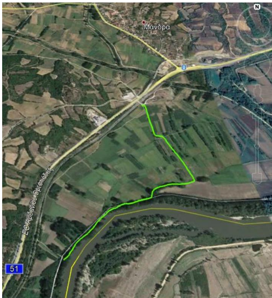
Εικόνα 1.α.1: Δρομολόγιο «Α» προς αποκατάσταση

(1) Περιοχή ΚΑΜΠΟΣ, νοτιοδυτικά χ. ΜΑΝΔΡΑ (δρομολόγιο «Α»), μήκους 6.500m, στο οποίο θα γίνει διάστρωση όπου απαιτείται από το νότιο άκρο του και για 2.620m.