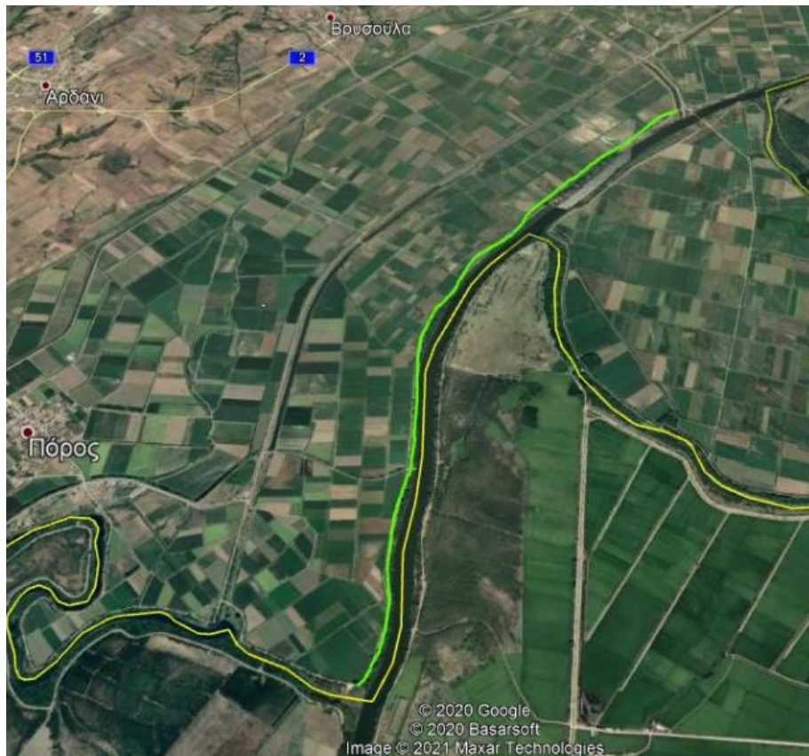
Εικόνα 1.α.2: Δρομολόγιο «Β» προς αποκατάσταση