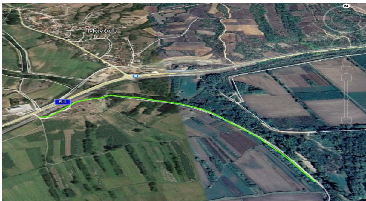
Εικόνα 1.α.7: Δρομολόγιο «Ζ» προς αποκατάσταση

(7) Περιοχή ΚΑΜΠΟΣ, νότια χ. ΜΑΝΔΡΑ (δρομολόγιο «Ζ»), μήκους 1.000m.