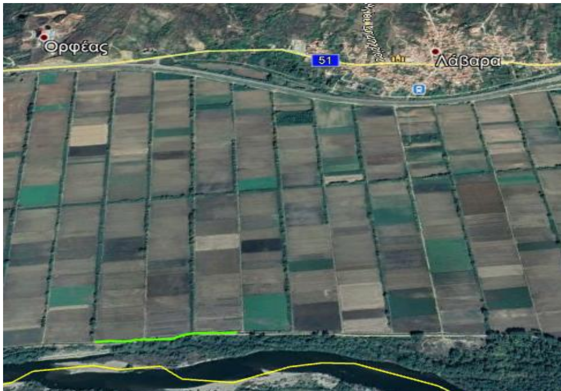
Εικόνα 1.α.4: Δρομολόγιο «Δ» προς αποκατάσταση

(4) Από περιοχή ΠΕΡΙΒΟΛΙΑ έως περιοχή ΜΟΙΡΕΣ, νότια χ. ΛΑΒΑΡΑ (δρομολόγιο «Δ»), μήκους 500m.