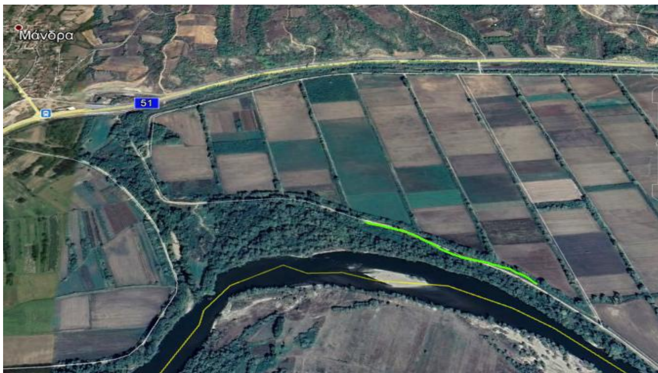
Εικόνα 1.α.5: Δρομολόγιο «Ε» προς αποκατάσταση

(5) Από περιοχή ΜΟΙΡΕΣ έως περιοχή ΡΟΔΩΝ, νοτιοανατολικά χ. ΜΑΝΔΡΑ (δρομολόγιο «Ε»), μήκους 500m.