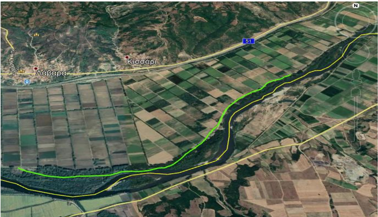
Εικόνα 1.α.3: Δρομολόγιο «Γ» προς αποκατάσταση

(3) Από ανατολικά χ. ΛΑΒΑΡΑ έως περιοχή ΠΕΡΙΒΟΛΙΑ, νότια χ. ΛΑΒΑΡΑ (δρομολόγιο «Γ»), μήκους 4.000m.