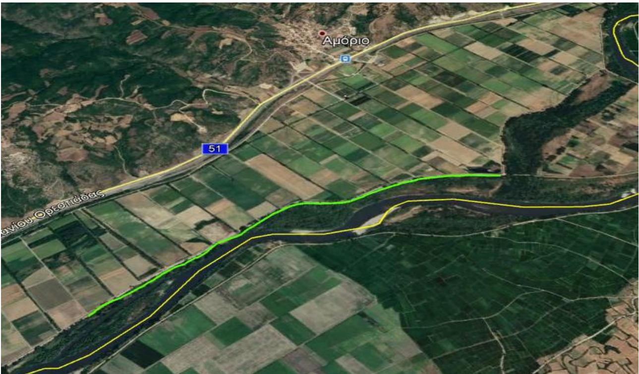
Εικόνα 1.α.2: Δρομολόγιο «Β» προς αποκατάσταση

(2) Περιοχή νότια χ. ΑΜΟΡΙΟΝ (δρομολόγιο «Β»), μήκους 2.500m.