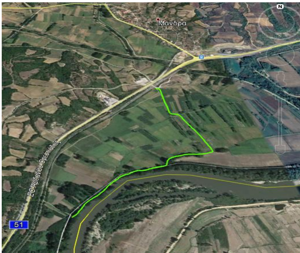
Εικόνα 1.α.6: Δρομολόγιο «ΣΤ» προς αποκατάσταση

(6) Περιοχή ΚΑΜΠΟΣ, νοτιοδυτικά χ. ΜΑΝΔΡΑ (δρομολόγιο «ΣΤ»), μήκους 6.500m, από το οποίο θα διαστρωθούν 1.460m.