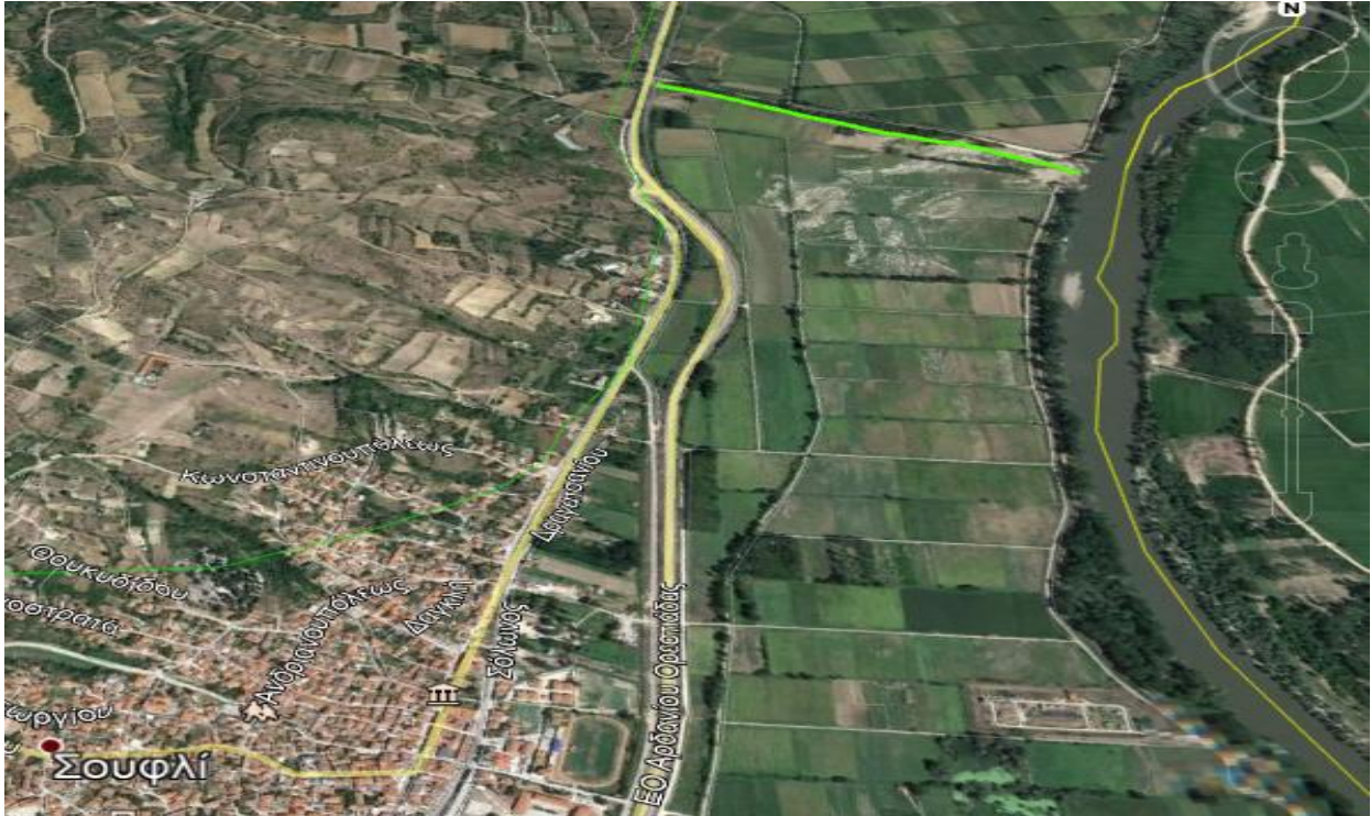
Εικόνα 1.α.10: Δρομολόγιο «I» προς αποκατάσταση