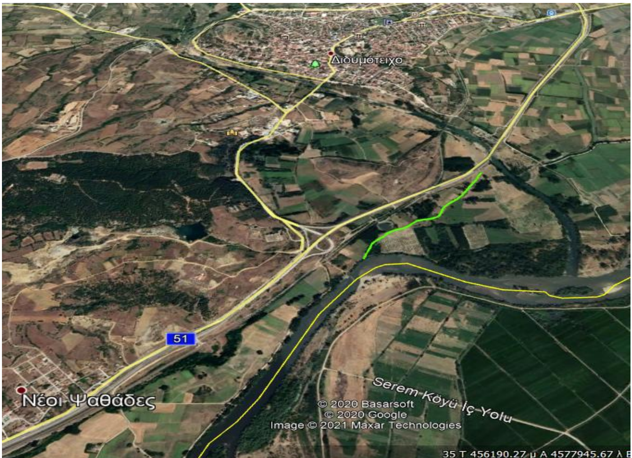
Εικόνα 1.α.1: Δρομολόγιο «Α» προς αποκατάσταση

(1) Από νοτιοανατολικά ΔΙΔΥΜΟΤΕΙΧΟΥ (ποτ. ΕΡΥΘΡΟΠΟΤΑΜΟΣ) έως βορειοανατολικά του χ. ΨΑΘΑΔΕΣ (δρομολόγιο «Α»), μήκους 1.000m.